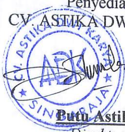
Butu Astika Direktur

Singaraja, 30 November 2017 Pejabat Penerima Hasil Pekerjaan Dinas Sosial Kab. Buleleng