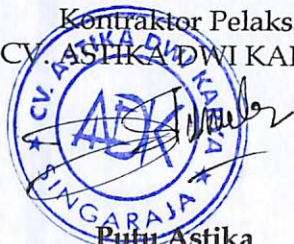
Putu Astika Direktur

PIHAK KEDUA Kontraktor Pelaksana CV. ASTIKA DWI KARYA