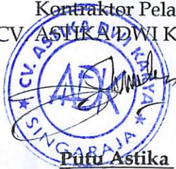
Pufu Astika Direktur

PIHAK KEDUA Kontraktor Pelaksana CV. ASTIKA DWI KARYA