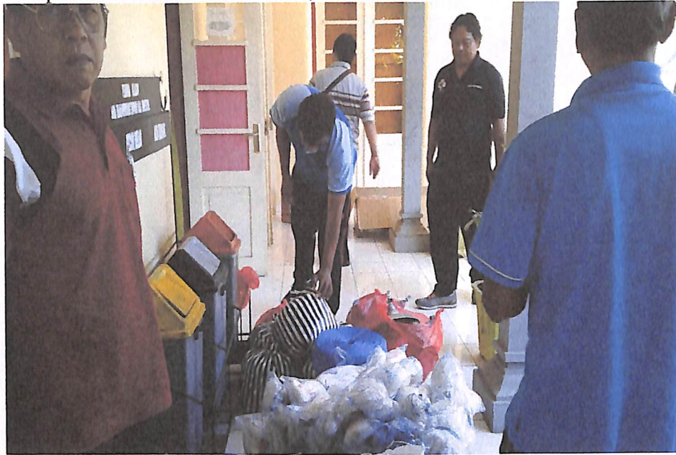
Poto Pekerjaan : Pengadaan Jaringan Tasi, Jukung Fiber Katamaran, Mesin Tempel 5 PK Mesin Genzet ET.1, Peralatan Genzet dan Ember