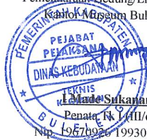
I Made Sukanara

Pihak Yang Memeriksa Hasil Pekerjaan Pejabat Pelaksana Teknis Kegiatan Pemeliharaan Gedung/Lingkungan Kantor Museum Buleleng