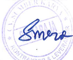
Ketut Sumerada DIREKTUR