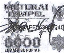
Kadec Arsana Ka. UL Singaraja